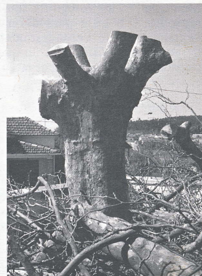
Calvaria — Plátano destruído

Normalmente as justificações dadas não fazem qualquer sentido, como neste caso em que a justificação dos responsáveis é tão ridícula quanto chocante, senão vejamos: “Trata-se de uma espécie