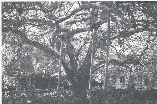
Portalegre — Plátano preservado