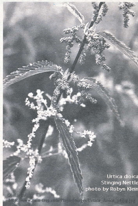
Urtica dioica Stinging Nettle